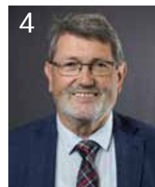
4 Klaus Schwab, 67 Dipl.-Ingenieur (FH)